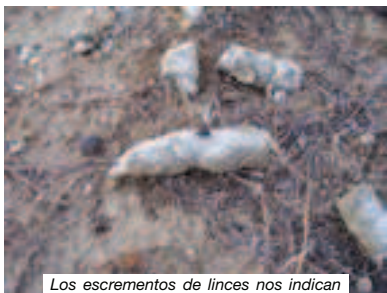
Los excrementos de lince nos indican los territorios por donde campea.

Nuestro viaje se inicia por los Montes Públicos de la Puebla del río, en la Cañada del Juncal que nos lleva hacia La Juliana . De ahí, y en el paraje conocido como Monte Martel , nos adentraremos en un mundo muy agreste y un ecosistema muy bien conservado, una masa forestal transitada por muchos ciclistas, senderistas, joggers y peregrinos rociros. No obstante, y a determinadas horas del día y en determinadas épocas, podremos contemplar fauna y flora excelente y en un estado