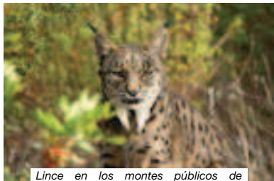
Lince en los montes públicos de Aznalcázar - Puebla

Algo realmente sorprendente es que la población de lince más sana y abundante de Doñana se encuentra en los Montes Públicos de Aznalcázar-Puebla del Río. El lince ibérico es el felino más amenazado del planeta y su salvación de la extinción es muy reciente. Se ha librado por los pelos. El esfuerzo de las Administraciones Comunitarias, central y autonómica, y un buen número de ONGs han impedido que esta joya se extinga. Por ello, visitar territorio lince requiere de unas normas de conducta y unas pautas de comportamiento muy estrictas y ES IMPRESCINDIBLE IR ACOMPAÑADO DE UN GUÍA EXPERTO AUTORIZADO, que los hay tanto en la Puebla como en Aznalcázar.