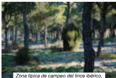
Zona típica de campeo del lince ibérico.

Cerca tenemos el Corredor Verde del Guadiamar y allí se encuentra el Vado del Quema y la imponente obra de restauración de medio natural que llevó a cabo la Junta de Andalucía tras el desastre de Azanalcóllar que alcanza, en este punto, su paradigma y máxima expresión. Tanto río Guadiamar arriba como río Guadiamar abajo las repoblaciones de fresnos, alisos, sauces,