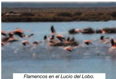
Flamencos en el Lucio del Lobo.

tipo de fringílidos y sus correspondientes tarabillas en invierno. El muro y sus alrededores en verano son un sitio ideal para aprender a distinguir los aláudidos, terreras marismeñas, comunes, cogujadas y se puede ver alguna montesina, alondras y calandrias. En cualquier época del año, al que le guste las aves rapaces, debe de darse un paseo por este tramo; aguiluchos incluido el papialbo, milanos, cernícalos, águi-