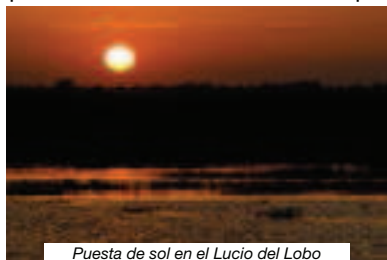
Puesta de sol en el Lucio del Lobo

tipo de aves y muchos limícolas: es territorio de cigüeñuelas, avocetas y algunas agujas colinegras. Hay que buscar a los archibebe claros y algunos combatientes y correlimos.