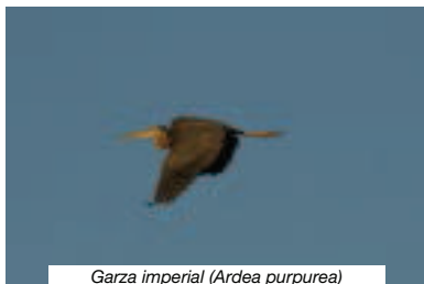
Garza imperial ( Ardea purpurea )

En el Centro de Visitantes situado en el término municipal de Aznalcázar, tenemos la oportunidad de ver contenidos educativos e interpretativos en sus paneles y resto de equipamientos. Es muy interesante y podemos entender los diferentes ecosistemas que componen el Parque Nacional.