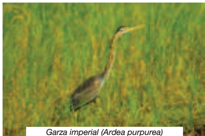
Garza imperial ( Ardea purpurea )

Los municipios de Sevilla aportan miles de hectáreas al Espacio Natural Doñana: destacable es el caso de Aznalcázar, que lo hace al Parque Nacional, al Natural y a la Reserva de Biosfera. Parajes como Las Nuevas, Brenes, El Lucio de los Ánsares, El Cherry, Marilopez, Caracoles, Cangrejo Chico, Cerrado Garrido o Matochal son todos aznalcazareños y míticos en la historia del Parque Nacional de Doñana.