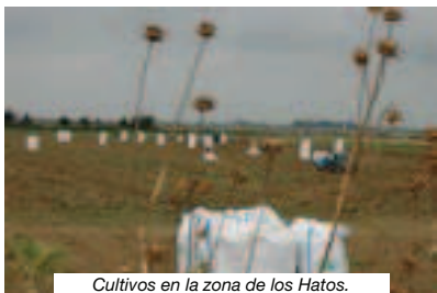
Cultivos en la zona de los Hatos.

El Caño de Guadimar es el límite entre la provincia y es quizás desde aquí, los Hatos Ratón y Blanco por ejemplo, desde donde se debe iniciar este recorrido. Es un principio un tanto duro pues atraviesa interminables zonas agrícolas del Sector II del Plan Almonte Marismas (Plan de puesta en regadío de la década de los sesenta del siglo XX de parte de las marismas del Guadalquivir) hasta que llega a zonas como es el Rincón del Pescador donde nos damos cuenta que empiezan a ocurrir muchas cosas. Indudablemente el año y la época de este viaje