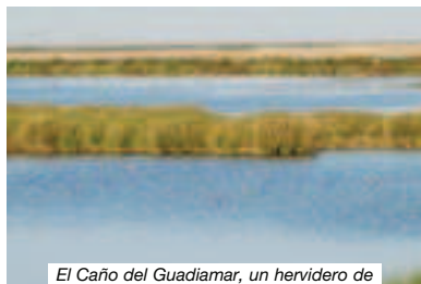
El Caño del Guadiamar, un hervidero de vida.

Previamente, entre arrozales de los hatos o pastizales, patatales o campos de girasol, si venimos de la Vuelta La Arena , nos encontraremos con Veta Hornitos . Este fue un sitio clave, en su día, para las cacerías de gansos. Tan sólo a unos cientos de metros podremos observar los mares de castañuela y las zonas inundadas del Guadiamar, ya en el Parque Natural. Es lugar de muchísima querencia para aves muy interesantes: podemos ver los flamencos y las garcetas grandes, espátulas, calamones, no fallan los somormujos lavancos, zampullines chicos, y siempre, en su época, se ve algún águila culebrera en alguno de los postes eléctricos. Este es uno de los mejores sitios para observar la rara cerceta pardilla, entre los meses de mayo y julio. Es un lugar muy bueno para disfrutar de la observación de aves de mañana y, desde el coche, podremos obtener muy buenas fotos ya que dejaremos el sol a nuestra espalda. Por la tarde todo está a contraluz.