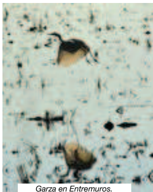
Garza en Entremuros.